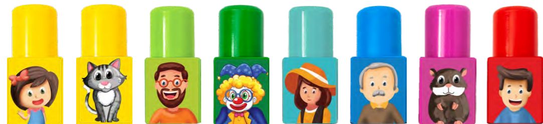
KUZYNKA KOT WUJEK KUZYN CIOCIA DZIADEK CHOMIK TATA