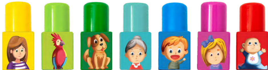
MAMA PAPUGA PIES BABCIA SYN CÓRKA DZIDZIA